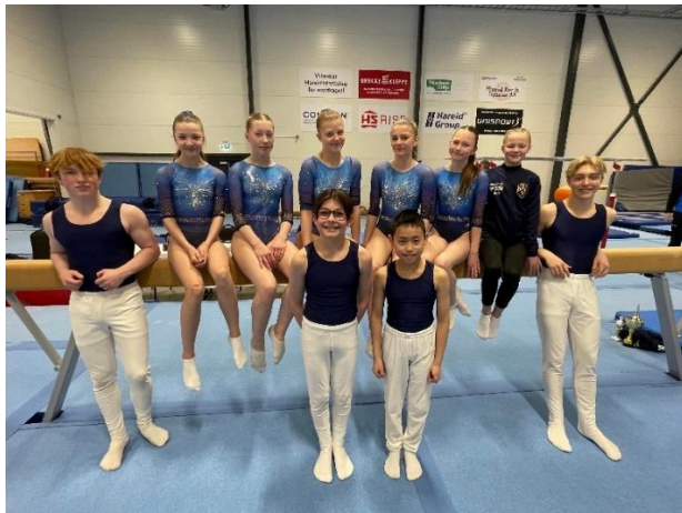
Regionskonkurransen nr. 1, Hareid, 11.-12. mars 2023